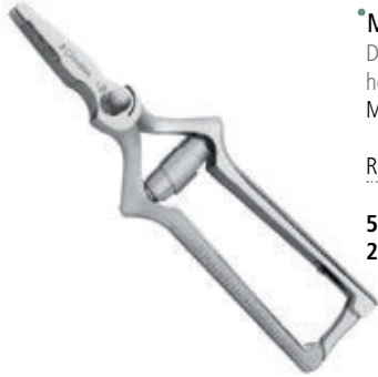
• MASTICADOR RECTO Desmontable. Guarderías, residencias, hospitales, etc. Marca: 3 Claveles