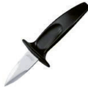
• ABREOSTRAS Acero inox. Mango de polipropileno. Marca: Arcos