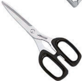
• TIJERAS UNIVERSAL Acero Inox. Mango plástico. Marca: Arcos