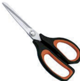
• TIJERAS ERGONÓMICAS Acero Inox. Mango plástico. Marca: Arcos