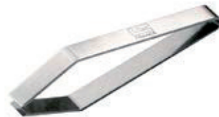
• PINZA ESPINAS Inox. Longitud: 11,5cm. Marca: Tellier