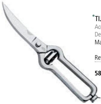
• TIJERAS TRINCHA AVES Acero Inox. Forjado en caliente. Dentada profesional. Marca: 3 Claveles