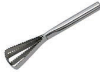
• ESCAMADOR 7905 Acero Inox. Marca: Arcos