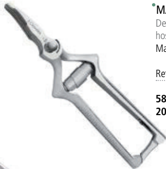
• MASTICADOR CURVO Desmontable. Guarderías, residencias, hospitales, etc. Marca: 3 Claveles