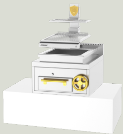
PVJ-50-1-1-CT 750 x 1111 x 850 mm TARIFA 11.250,00 €