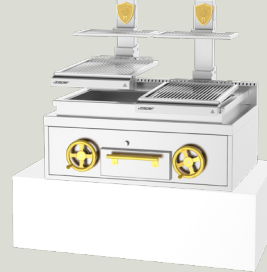
PVJ-50-2-1-CT 1210 x 1111 x 900 mm TARIFA 19.975,00 €