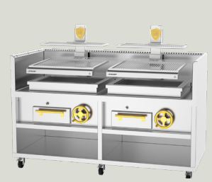
PVJ-76-2-1-MB 2069 x 1610 x 900 mm TARIFA 34.950,00 €