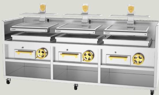
PARRILLA VASCA PVJ-76-3-3-MB (Monoblock)