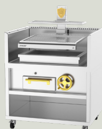
PVJ-76-1-1-MB 1150 x 1610 x 900 mm TARIFA 19.500,00 €