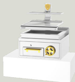
PVJ-76-1-1-CT 910 x 1111 x 850 mm TARIFA 12.750,00 €