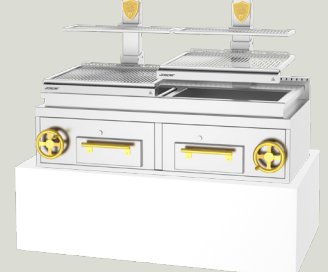
PVJ-76-2-1-CT 1700 x 1111 x 850 mm TARIFA 24.500,00 €