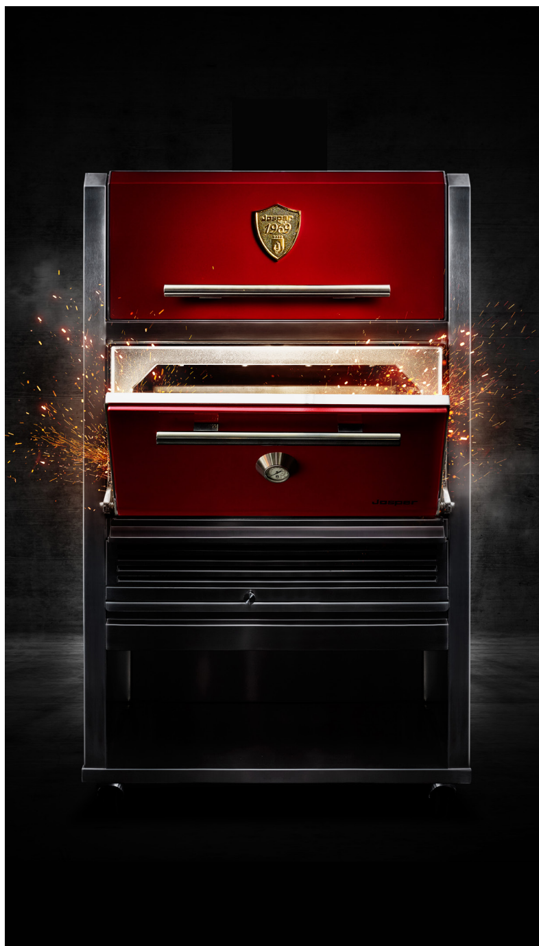
Horno Brasa Jospier HJA - PLUS - L175