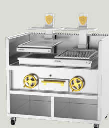
PVJ-50-2-1-MB 1400 x 1610 x 900 mm TARIFA 26.975,00 €